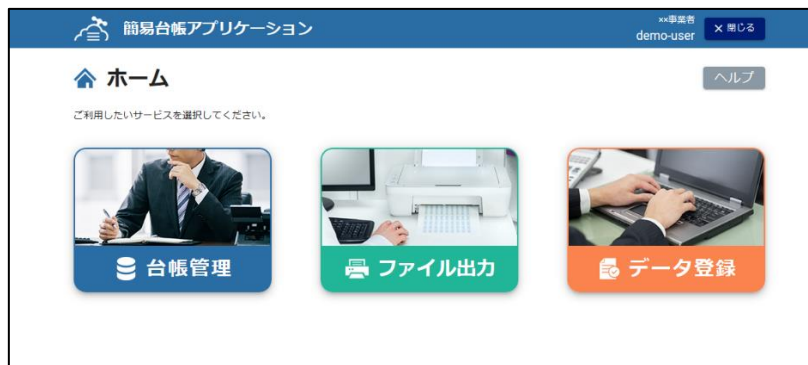
図 2-1: 簡易台帳アプリケーションホーム画面

本アプリケーションは、水道標準プラットフォーム上で動作する、主に小規模事業者への水道施設台帳の電子データ化の推進とデータ整備を目的として提供するアプリケーションです。