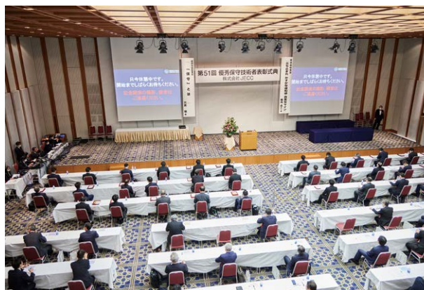
3年ぶりに、全国各地から受賞者らが集う式典となった

弊社が、ブランドスローガンとして掲げております「ITとファイナンスを、プロデュース。」のように、ITとファイナンスを融合した、多様で先進的なサービスを通じ、戦略的なIT利活用の実現をプロデュースする企業として、持続可能な環境・社会づくりの実現に向けた努