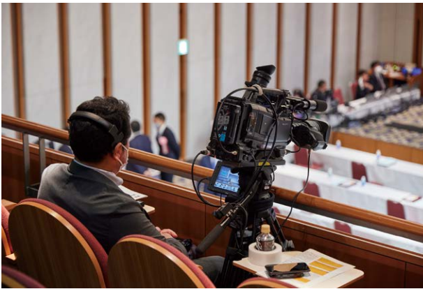
リアル開催の様子はWebでも同時配信された