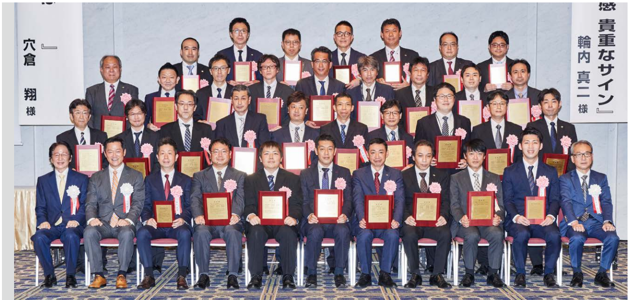
表彰式典終了後に記念撮影する受賞代表者一同