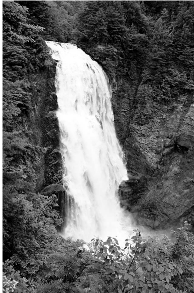
滝の側の爽快感はマイナスイオンが豊富だからだともいわれる

か水」など、商品の販売戦略に「科学っぽい」手段が使われたことがありました。中には、明らかに詐欺、もしくは詐欺に通じる行為に使われてしまう疑似科学もありますが、「今の時点では実際に証明できない」ために疑似科学と呼ばれてしまっているのもあるので、その判別は難しいところです。