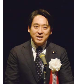
挨拶する平木大作 経済産業大臣政務官